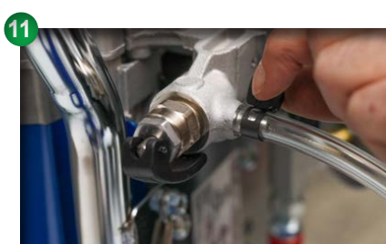
11 Rücklaufschlauch anbringen und mit Klemme befestigen