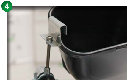
4 Oberbehälter aus Halterung entfernen