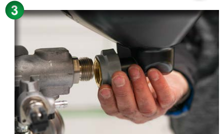
3 Oberbehälter abschrauben