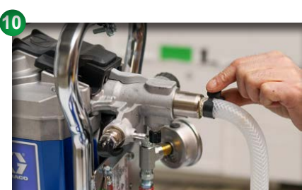
10 Saugschlauch anbringen und mit Klemme befestigen