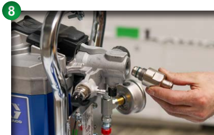
8 Adapter für Saugschlauch einsetzen