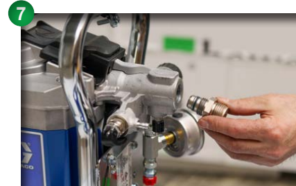
7 Adapter für Oberbehälter entfernen