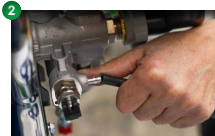
2 Rücklaufschlauch am Gerät entfernen