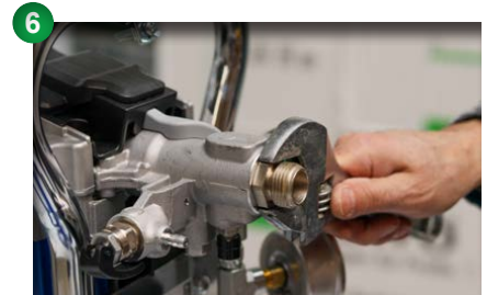
6 Adapter für Oberbehälter lösen