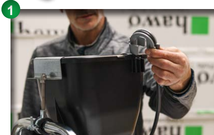
1 Rücklaufschlauch am Oberbehälter entfernen