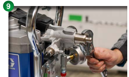
9 Adapter für Saugschlauch festziehen